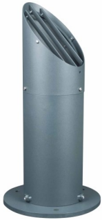
Stickan-Mark 130, grafitgrå, inkl skyddsgaller