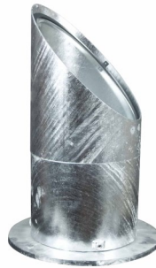
Stickan-Mark 200, varmgalvaniserad